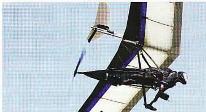
Antrieb in Aktion. Le moteur en action.