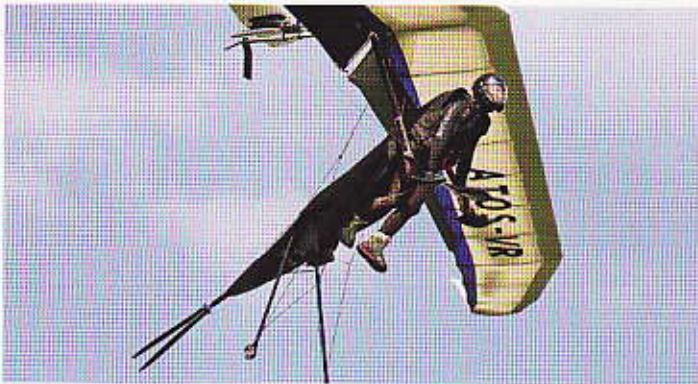
Abgeschaltet, Landeanflug. Motor coupé, planer final.