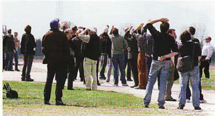
Den Ohren bringt's nichts – dafür den Augen. On s'en met plein les yeux, pas les oreilles.

in der Nähe im Einsatz war, verursachte 90 dB. Und beim normalen Gespräch, in 1½ m Abstand, zeigte das Gerät 55 bis 60 dB.